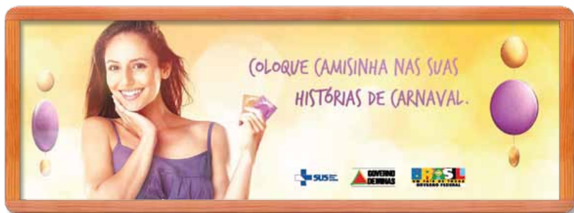
Modelo de outdoor veiculado pelo governo de Minas Gerais durante o período de Carnaval

As falhas de alguns poucos exibidores acabaram refletindo no meio de uma forma geral. Recebemos várias reclamações relacionadas com atrasos de início