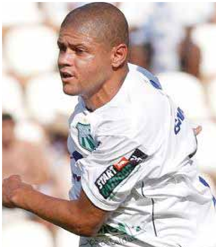
A logomarca Start Outdoor estampa a camisa da Caldense

Em investimento inédito a empresa de mídia exterior, Start Outdoor se uniu ao Banco BMG, Unimed, GM Costa Transportes e Peugeot para patrocinar a camisa oficial da Associação Atlética Caldense de Poços de Caldas na disputa do Campeonato Mineiro de Futebol 2011 da 1ª. Divisão.